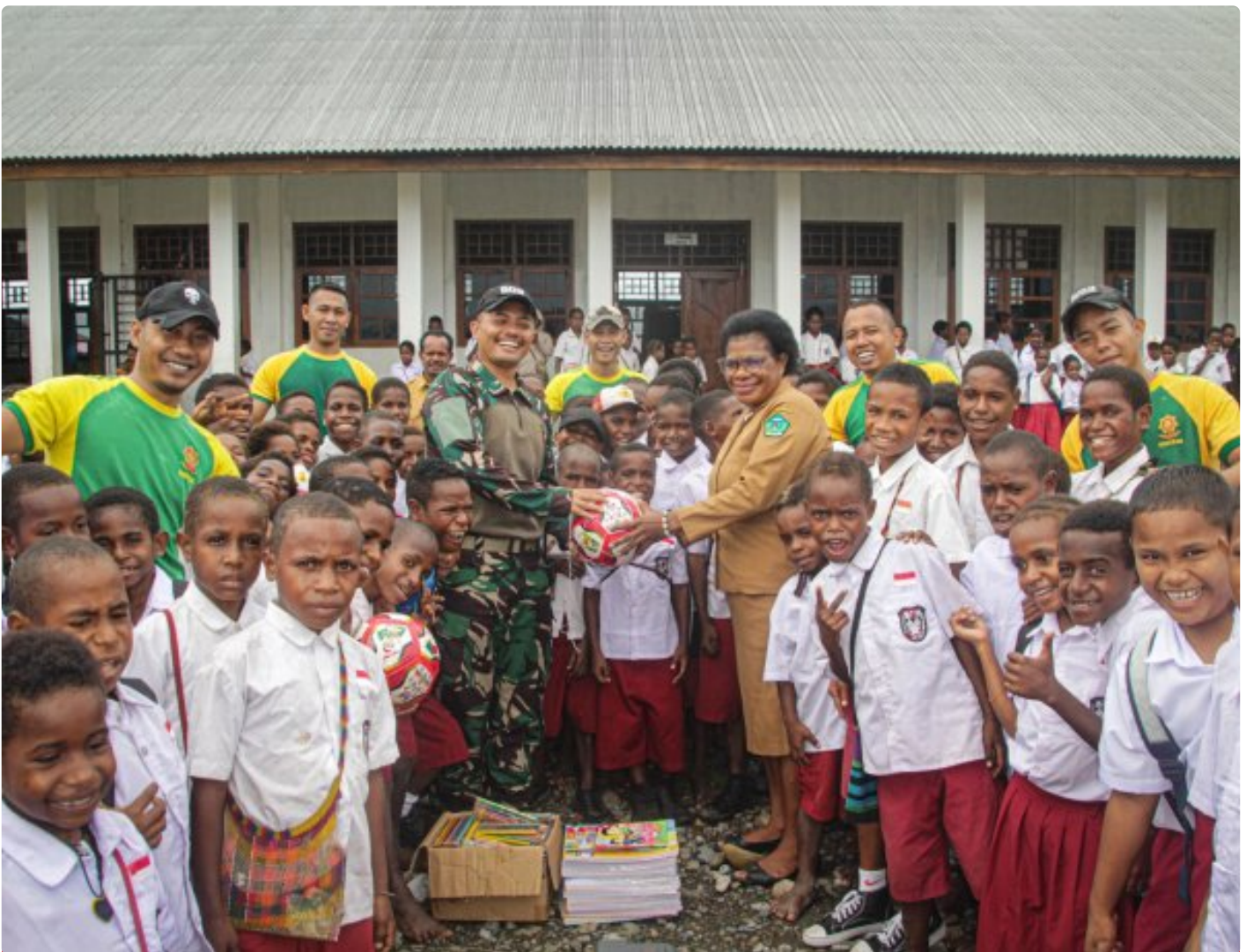
Foto: Satgas Pamtas Mobile RI-PNG Yonif 503/Mayangkara mendistribusikan sarana belajar ke SD Gabungan Distrik Kenyam, Kabupaten Nduga, Papua, pada Minggu (09/02/2025).

NDUGA- Dalam upaya mendukung pendidikan di daerah perbatasan, Satgas Pamtas Mobile RI-PNG Yonif 503/Mayangkara mendistribusikan