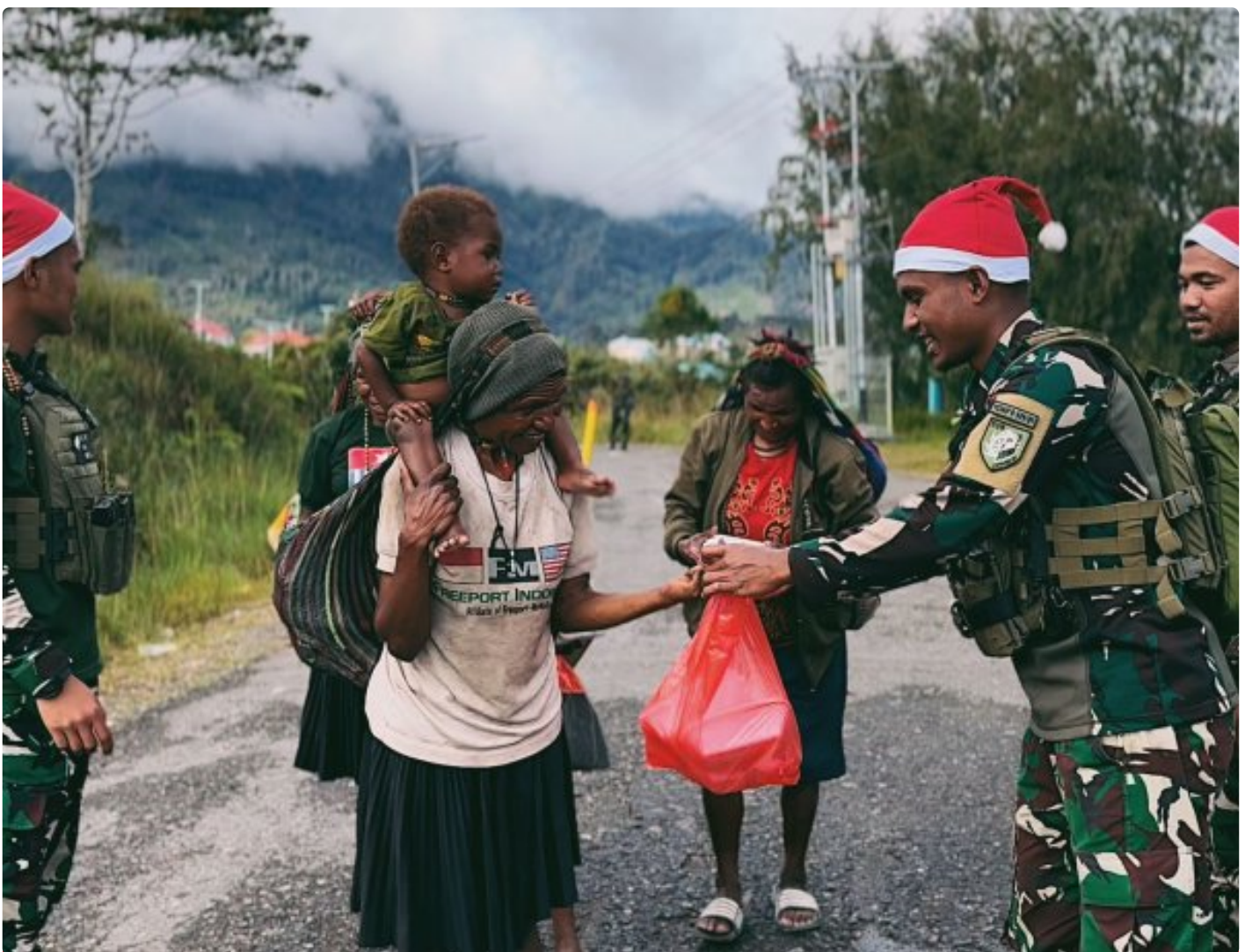
Foto: Satgas Yonif 509 Kostrad memberikan makna baru pada patroli keamanan dengan berbagi kebahagiaan bersama masyarakat di Intan Jaya, Papua.

PAPUA- Dalam balutan semangat Natal yang damai, Satgas Yonif 509 Kostrad memberikan makna baru pada patroli keamanan dengan berbagi kebahagiaan